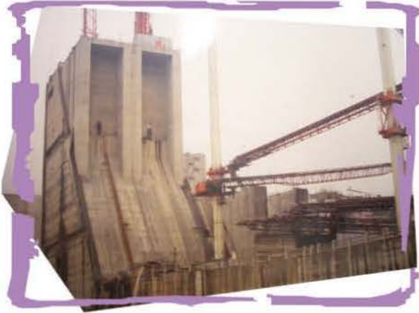
興建中的 180 米高長江三峽大壩

三峽所指的是長江沿岸的瞿塘峽，巫峽及西陵峽。而三峽工程就是指在重慶至宜昌一段的長江流域，所開展的大型水利工程。這項舉世觸目的水利工程項目，對環境、民生及經濟三方面，都帶來了利與弊。