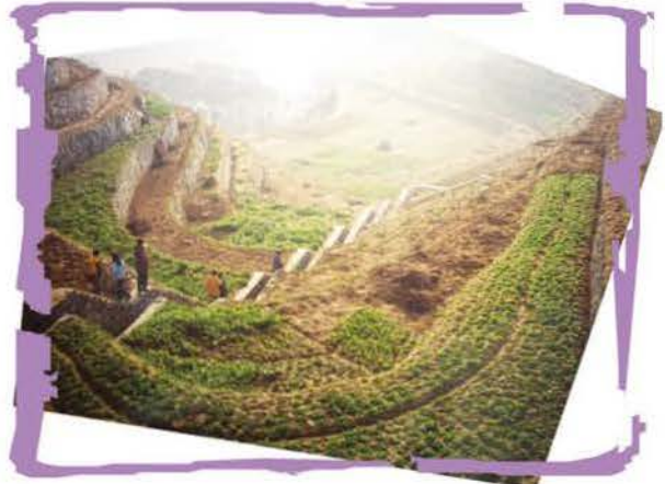
部份受影響的居民需要遷到高地