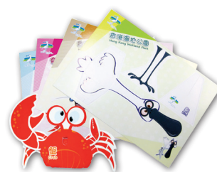
動物立體摺紙(A5大小)